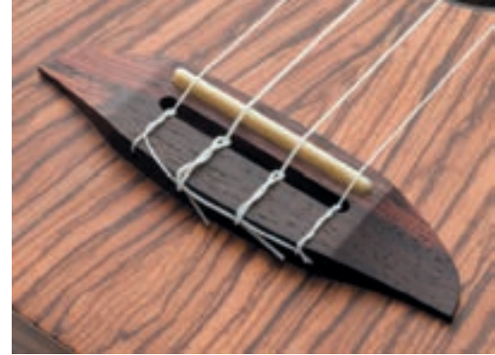
Nach Konzertgitarren-Art: Steg zum Durchfädeln

Richtig positiv überrascht werde ich von allen vier beim Spiel über Verstärker. Klasse, wie der typisch relaxte Sound auf die Speaker transportiert wird. Dicker Pluspunkt! Das musste natürlich auf der nächsten Probe mit Band ausprobiert werden. Funktionierte großartig: gute Durchsetzung, keine Feedback-Probleme, ein prima Add-On-Sound, der so manchem Song einen neuen Twist geben kann.