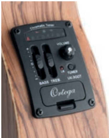
Von Shadow und richtig gut: UK-300T