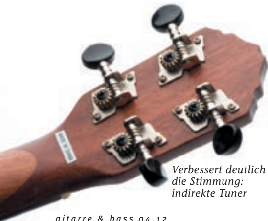
Verbessert deutlich die Stimmung: indirekte Tuner

Tja, Praxis ... Ist ja nicht so, als wäre ich seit Jahren als Ukulelen-Virtuose unterwegs. Aber so geht’s wohl den meisten – also ruck-zuck eine Griffabelle aus dem www gezogen und ab dafür! Cool, das kostet gerade mal ein paar Minuten und schon schrummelt man den ersten 3-Akkorde-Song. Sofort macht sich dieses relaxte Laid-Back-Jack-Johnson-So-What-Feeling breit, verbunden mit dem starken Verlangen nach