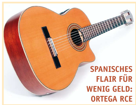
SPANISCHES FLAIR FÜR WENIG GELD: ORTEGA RCE

Die RCE131 ist eine klassische Konzertgitarre mit Cutaway, sie verfügt über eine massive Zederndecke und einen Korpus aus Mahagoni. Der Hals ist ebenfalls aus Mahagoni gefertigt, Kopfplatte und Halsfuß sind angesetzt. Eine typisch klassisch-rustikale Rosette verziert das Schalloch, Decken- und Boden-Einfassung bestehen aus Echtholz. Das Griffbrett verfügt über 18 nutzbare Bünde und ist aus einem Palisander-ähnlichen Holz mit dem exotischen Namen Sonokelin gefertigt. Die Kopfplatte ist ganz nach klassischer Manier in Fensterform gehalten, auf Verzierungen oder ein Furnier wurde verzichtet. Sattel und Stegeinlage sind aus Kunststoff, der Knüpfsteg selbst ist mit einem Streifen Echtholz hinterlegt. Die komplette Gitarre ist seidenmatt lackiert.