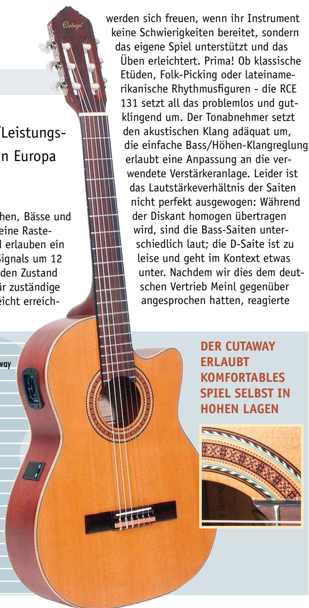
DER CUTAWAY ERLAUBT KOMFORTABLES SPIEL SELBST IN HOHEN LAGEN